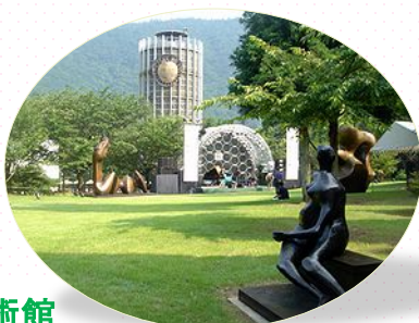
箱根彫刻の森美術館