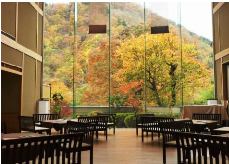
ロビーからはこの風景🍁

日光江戸村はタイムスリップした気分になります。忍者のパフォーマンスもやっていますよ♪