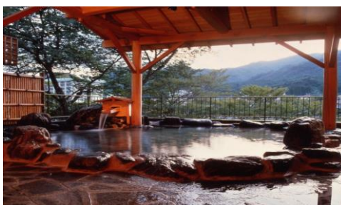
落ち着いた雰囲気です♪

また、レーザーショーや屋外では踊る噴水ショーなどエンターテインメントも充実しています。