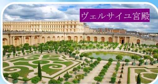
ヴェルサイユ宮殿

フリープランではパリ市内でお買い物やスイーツ巡りがお勧めです。日本に出店しているお店も多いですが、本場は違う!ぜひ立寄ってみてください。