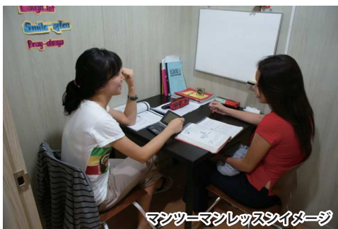
マンツーマンレッスンイメージ

Cebu Doctor's University (CDU) ESL Center