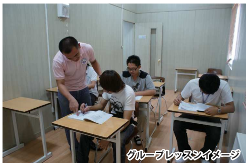
グループレッスンイメージ