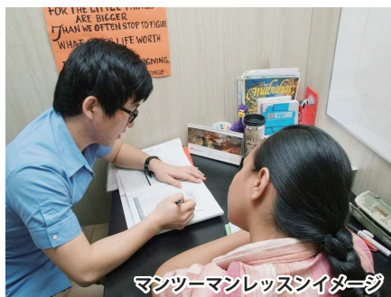
マンツーマンレッスンイメージ

リーズナブルな価格、時差があまり無い、日本人の苦手なスピーキング能力を磨くことができるマンツーマン授業が主流のフィリピン英語研修は、最近では社会人の企業研修としても利用するほど人気です。