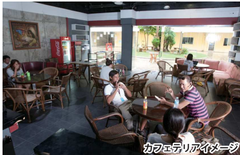
カフェテリアイメージ