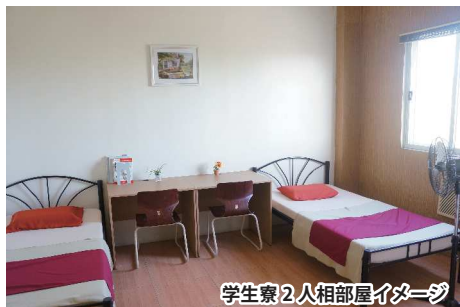
学生寮2人相部屋イメージ