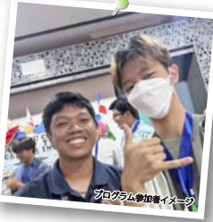
プログラム参加者イメージ