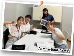
プログラム参加者イメージ

海外に行ってみたかったので参加しました。授業を通じ現地の人と簡単な会話でコミュニケーションをとる事ができました。講師の方はこちらが話し終えるまで熱心に聞いてくれました。