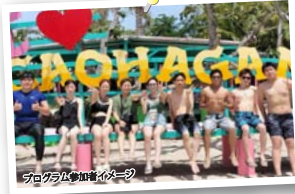
プログラム参加者イメージ