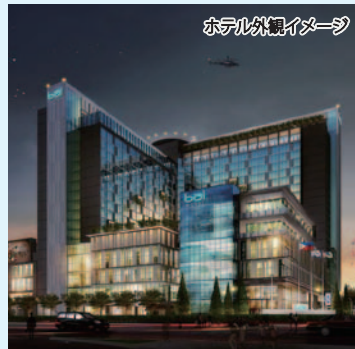
ホテル滞在イメージ

ステイ先と教室はセブ島・マンドラウエに2017年にオープンした23階建て、客室668室の4つ星ラグジュアリーホテル。フィリピン留学の最大のネックであった滞在環境と食事の問題が一気に解決。ホテルの目の前にはショッピングモールもあり、食事、買い物、人気の観光スポットへのアクセスが便利なエリアです。