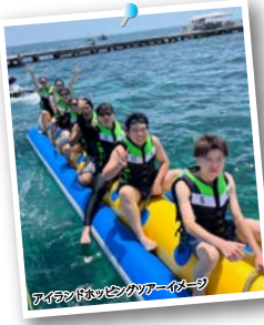
アイランドホッピングツアーイメージ