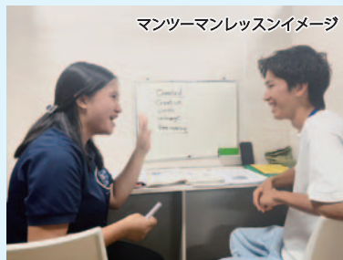
マンツーマンレッスンイメージ